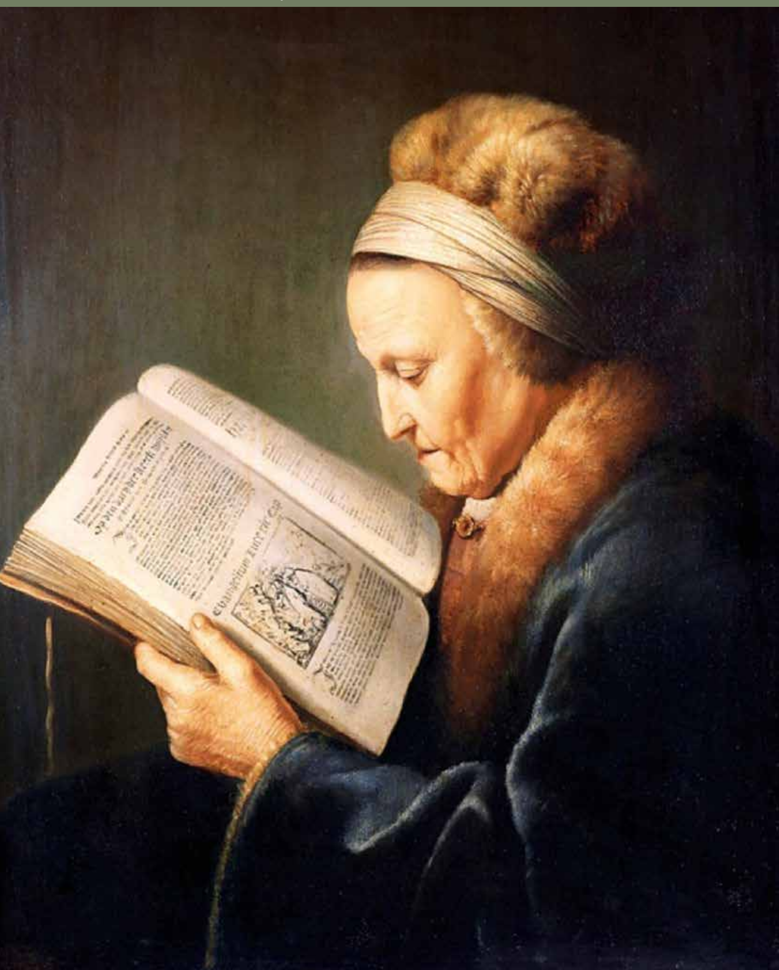
Oude vrouw leest in de Bijbel. Gerard Dou 1632.